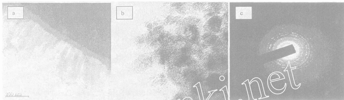
图 1 在阳极氧化铝模板上沉积的 \text{TiO}_2 的 TEM 图