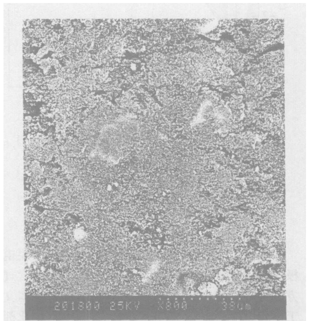
图 1 Nafion 乳液法所制催化层表面的 SEM 图像

在将墨水涂覆到 Nafion 膜上时, Nafion 膜一直保持平整, 没有溶胀现象, 所涂催化层紧密地粘合在 Nafion 膜上, 形成的 MEA 可任意弯曲而不引起催化层的剥离. 此 MEA 制作方法操作简单, 无需热压, 适合规模化制备. 由本方法所制电极的表观平整度远优于作者用其它方法制作的催化层, 在普通显微镜下观察不到催化层的裂缝. 图 1 是该催化层表面的 SEM 图像, 虽然催化层表面分布有些尺寸较细的沟缝, 但总体平整度优于其它方法结果.